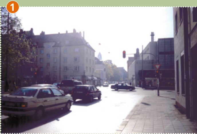
Kreuzung Landsberger Straße/Bäckerstraße