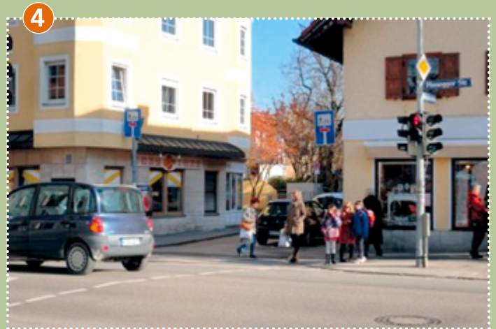
Planegger Straße/Am Kloostergarten/Bodenstedtstraße