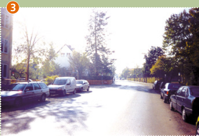
Kreuzung Georg-Habel-Straße/ Bodenstedtstraße